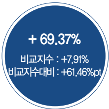
최근 5년 성과